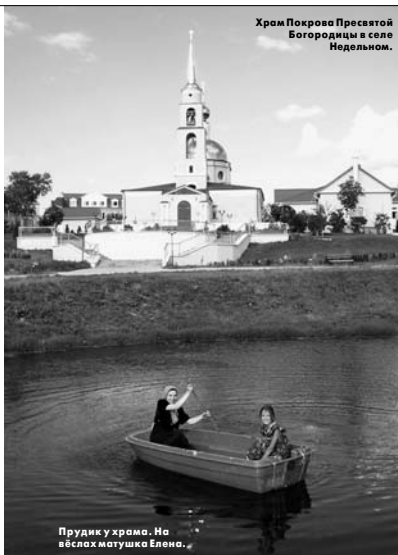
Храм Покрова Пресвятой Богородицы в селе Недельном.